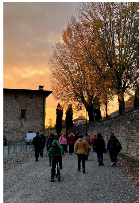
Via G. B. Camozzi, Verso Cascina Fui